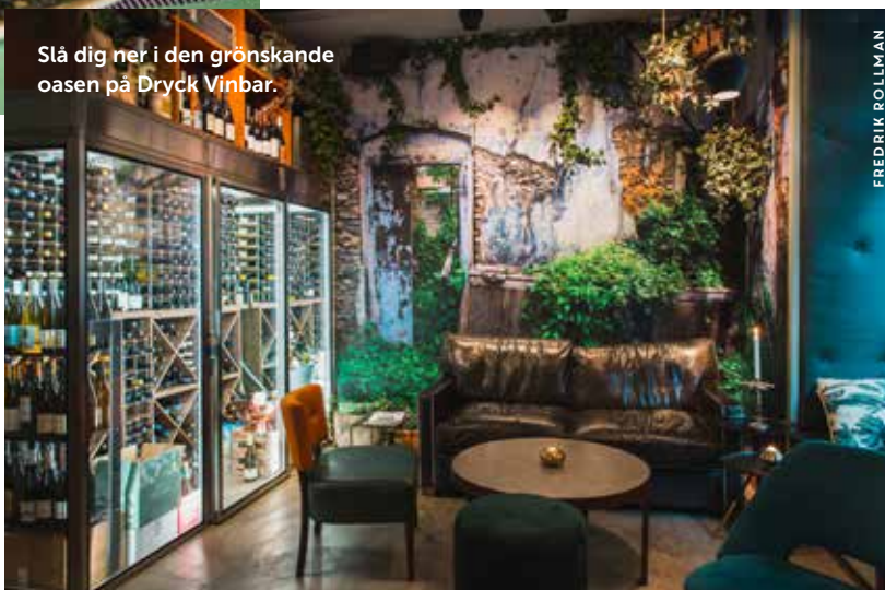
Slå dig ner i den grönskande oasen på Dryck Vinbar.