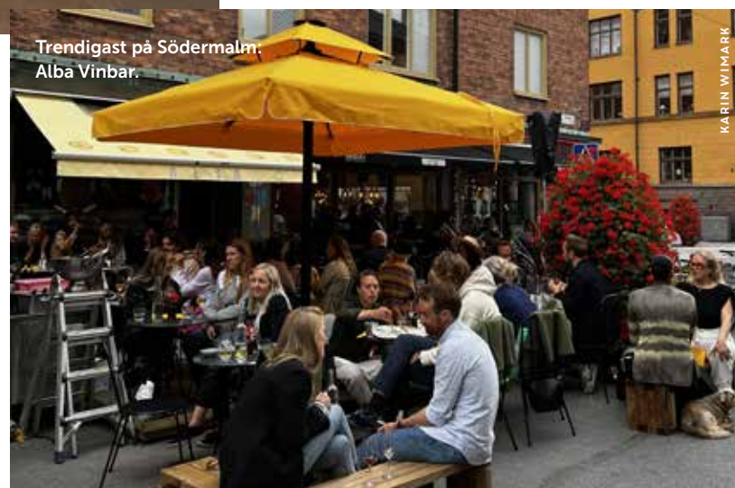
Trendigast på Södermalm: Alba Vinbar.