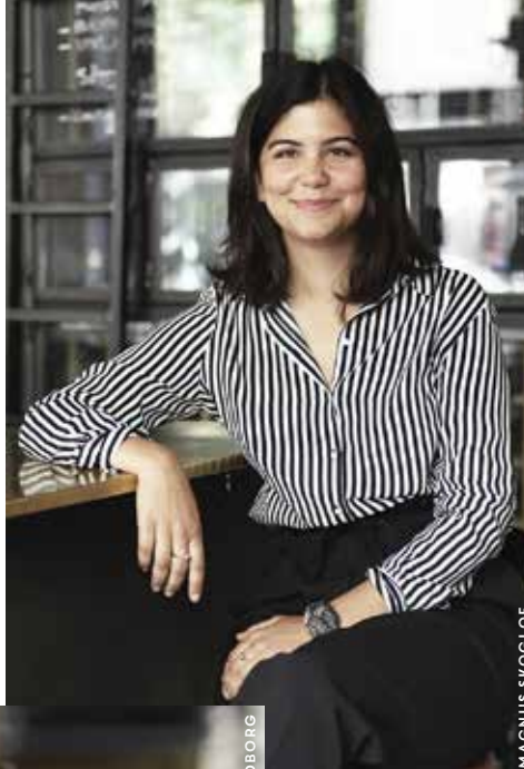
Folii är en prisad vinbar där halvglas går utmärkt att beställa.